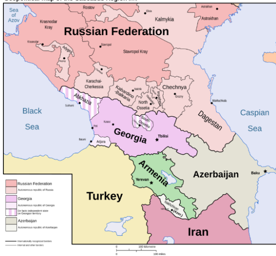
Geopolitical map of the Caucasus Region 2019

Όπως φαίνεται, προετοιμάζονται ή αρχίζει να ανοίγει η όρεξή τους για να επιχειρήσουν διείσδυση στην περιοχή του Καυκάσου με προετοιμασία του εδάφους στη Μ. Ανατολή, φέρνοντας το Κουρδικό ζήτημα στην πρώτη γραμμή και αξιοποιώντας την ανάγκη που έχει η άρχουσα τάξη του Ισραήλ να αναζητεί τρόπους επέκτασης του μικρού της χώρου, που θα την απομακρύνει από την εδαφική ασφυξία. Και αυτό μπορεί να το πετύχει με προσάρτηση περισσότερων εδαφών σε βάρος των Παλαιστινίων και με αμυντικές και στρατιωτικές συνεργασίες, όπως αυτές που ανέπτυξε με τις κυβερνήσεις της Ελληνικής