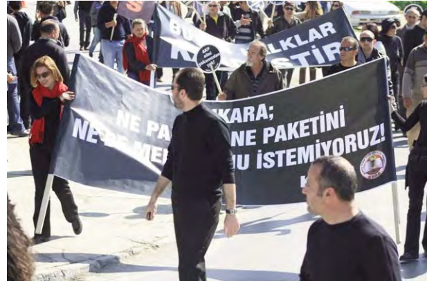
Pankart: Ankara; Ne paranı, ne paketini, ne de mumurunu istemiyoruz!

boyutta Kıbrıslı-Türkiyeli tartışması yaşandı. Birçok bakan, AK Parti yetkilisinin yanında televizyon ve gazetelerden de söz deloları devam etti ortam daha da gerildi. İkinci randevuya; yani 2 Mart'a gelinirken bütün taşlar yerinden oynatıldı. "Varoluş Mitingi", Türkiye'den özürlü mitingine dönüştürüldü.