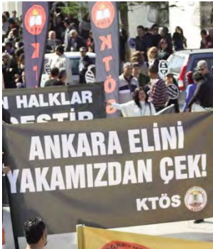
Pankart: Ankara elini yakamızdan çek!

Tüm dünyada sınırsız özgürlüklerle dolaşan sermaye, yaşadığı ekonomik krizi yumuşatma adına örgütlü bulunduğu kuruluşlar aracılığıyla dünya halklarının kazanılmış haklarına karşı çok ciddi bir savaşa girişmiştir. Soğuk savaş mı sıcak savaş mı, ne demek gerek bilmiyorum; ama bir savaş olduğu açıktır. Emekle sermaye arası bir savaş.