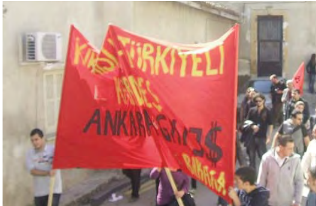
Pankart: Kıbrıslı Türkiyeli kardeş, Ankara Kalles...

Kıbrıs'ın tarihinde ilk kez bu kadar büyük bir